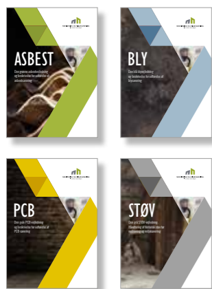
Sektionen har udgivet disse 4 vejledninger.

Det miljø- og sundhedsskadelige stof PCB er et udbredt problem i danske bygninger. I takt med den stigende fokus på PCB i byggeriet, oplever medlemmerne af Nedrivning- og Miljøsanering en sektion i Dansk Byggeri en stigende efterspørgsel på sanering af byggematerialer med indhold af PCB.